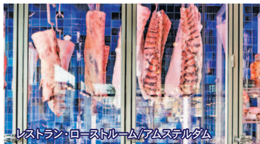
レストラン・ローストルーム/アムステルダム