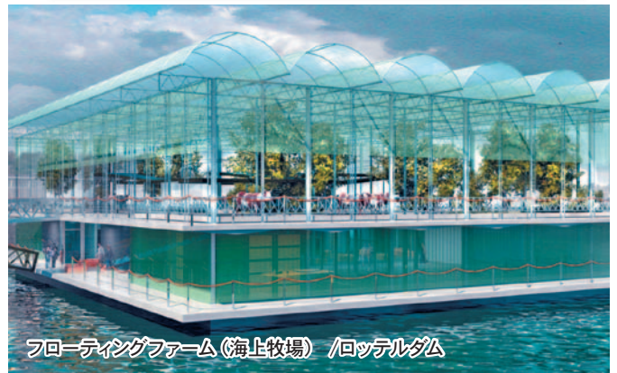
フローティングファーム（海上牧場）/ロッテルダム