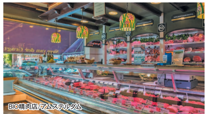
BIO精肉店/アムステルダム