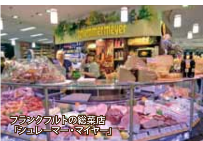
フランクフルトの総菜店「シュレーマー・マイヤー」