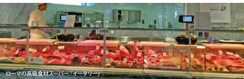
ローマの高級食材スーパー「イーター」