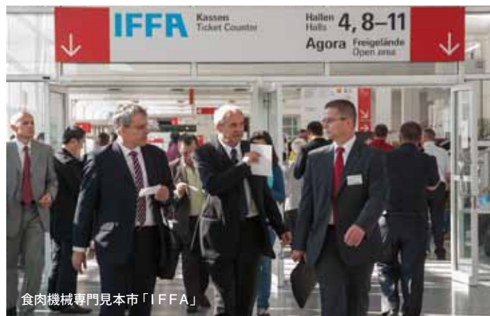
食肉機械専門見本市「IFFA」