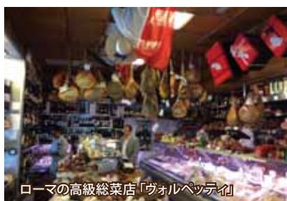
ローマの高級総菜店「ヴォルベッティ」