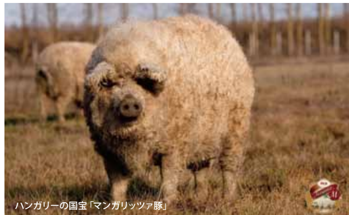
ハンガリーの国宝「マンガリツァ豚」