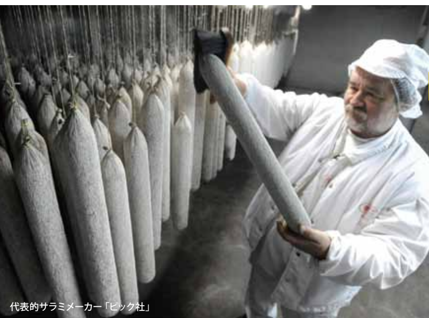
代表的サラミメーカー「ピック社」

食肉業界に携わるお仲間との出会い、そして刺激を受けることが出来る視察ツアーです。本ツアーに参加することにより、新たな交流と仕事の発展が期待できる貴重な企画となっております。ぜひご参加ください!