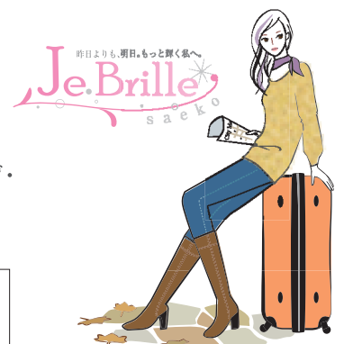
Je Brille-saeko(ジュ・ブリ・サエコ)は、内面からの美しさ、睡きを求める女性のための、トラベルアイが提案するブランドです。

※ IFAは1985年にプロフェッショナルアロマセラピストのための組織として設立され、会員により支えられている慈善団体として運営されています。英国はもちろんのこと、ヨーロッパ諸国、オーストラリア、カナダ、アメリカ、チリ、南アフリカ、日本、香港、中国、シンガポールなど世界中に会員を持つ国際的な組織です。